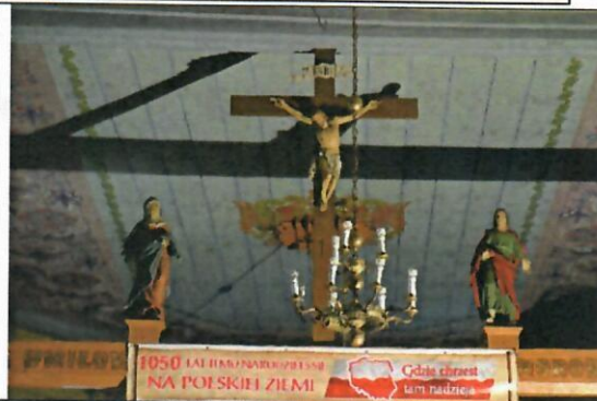
Fot.4 Grupa rzeźb pasyjnych na belce tęczowej. Widok od nawy gł.