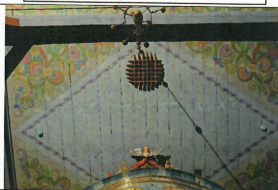
Fot.6 Polichromia stropu nawy nad chórem i prospektem.