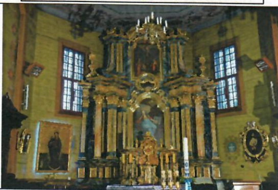
Fot.3 Ściany prezbiterium po obu stronach ołtarza głównego.