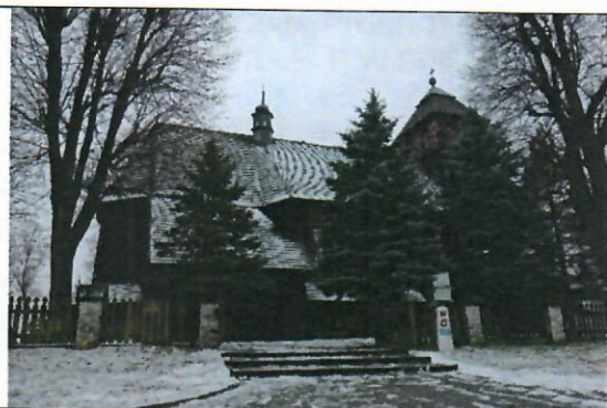
Fot.1 Bryła kościoła wraz z wieżą od strony północnej